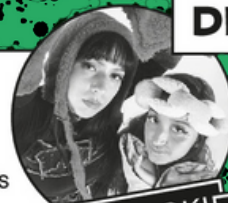
KALISSOKI & MEFELIBATA

Venez lâcher vos meilleurs couplets et vos plus beaux pas de danses !